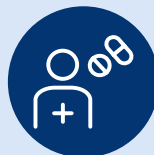
(und andere Symptome)