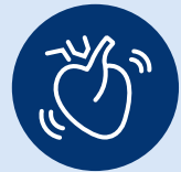
starkes Herzklopfen/ Herzrasen